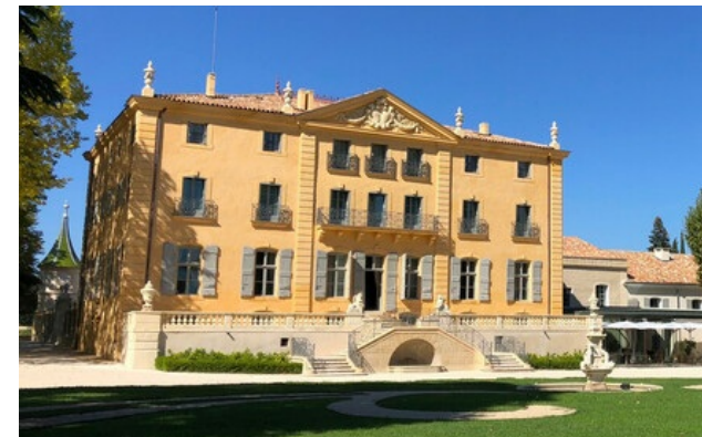
Membro Relais & Châteaux dal 2018 Route de Saint Canadet 13610, Le Puy-Sainte-Réparade (Bouches-du-Rhône)