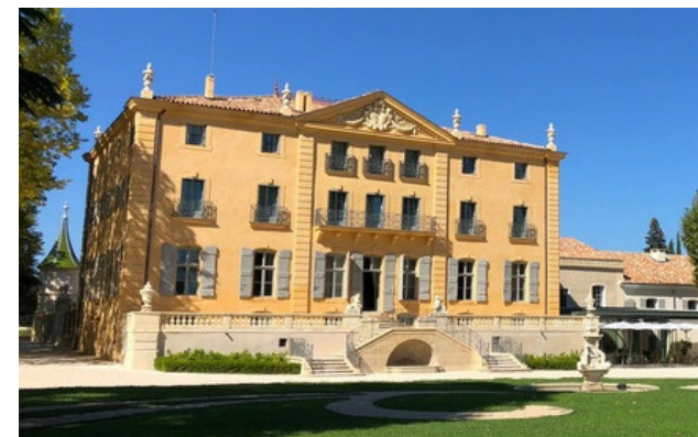
Membro Relais & Châteaux dal 2018 Route de Saint Canadet 13610, Le Puy-Sainte-Réparade (Bouches-du-Rhône)