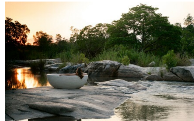
Membro Relais & Châteaux dal 1993 Sabi Sands Game Reserve 1350, Kruger National Park

Lodge e ristorante in una riserva naturale. Questa riserva di caccia privata, sostenuta da Nelson Mandela e situata nel cuore della riserva Sabi Sand, incarna tutto ciò che ci si aspetta dall'Africa: un luogo che si muove al ritmo intenso dell'indomita Savana. La gestione della riserva è in mano alla stessa famiglia da 89 anni ed è oggi la quarta generazione dei Varty ad accogliervi in un lodge in perfetta armonia con l'ambiente. I tre campi in riva al fiume Sand - Tree, Pioneer e The Private Granite Suites - sono impregnati dell'eleganza e del fascino ereditati dalla loro lunga storia. La cucina esalta gli ingredienti freschi locali ed è servita con classe nel cuore della natura.