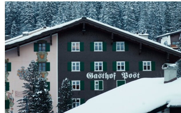
Membro Relais & Châteaux dal 1976 Dorf 11 6764, Lech am Arlberg (Vorarlberg)

Hotel e ristorante in montagna. Questo storico albergo, il Gasthof „Post“, è situato nel centro di Lech, una destinazione famosa in tutto il mondo per gli sport invernali. La lunga storia familiare dei luoghi, il suo fascino di casa di campagna, i pezzi d'antiquariato locale e un'amorevole attenzione ai dettagli creano un'atmosfera accogliente. Nei ristoranti pluripremiati per la bontà della loro cucina vi attendono dei piatti deliziosi. Il relax è completo alla Spa Badehaus, con la sua piscina panoramica spettacolare in mezzo alle montagne e delle suite per i trattamenti situate in una posizione straordinaria, nel cuore di un bell'orto botanico.