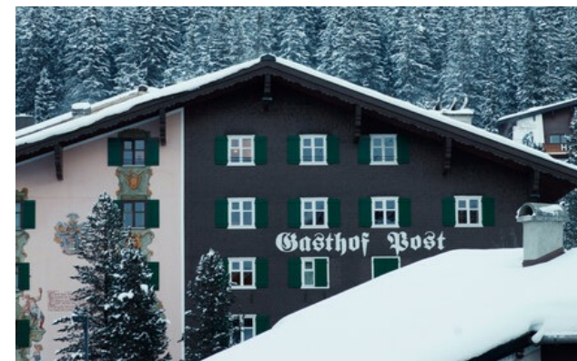
Membro Relais & Châteaux dal 1976 Dorf 11 6764, Lech am Arlberg (Vorarlberg)

Hotel e ristorante in montagna. Questo storico albergo, il Gasthof „Post“, è situato nel centro di Lech, una destinazione famosa in tutto il mondo per gli sport invernali. La lunga storia familiare dei luoghi, il suo fascino di casa di campagna, i pezzi d'antiquariato locale e un'amorevole attenzione ai dettagli creano un'atmosfera accogliente. Nei ristoranti pluripremiati per la bontà della loro cucina vi attendono dei piatti deliziosi. Il relax è completo alla Spa Badehaus, con la sua piscina panoramica spettacolare in mezzo alle montagne e delle suite per i trattamenti situate in una posizione straordinaria, nel cuore di un bell'orto botanico.