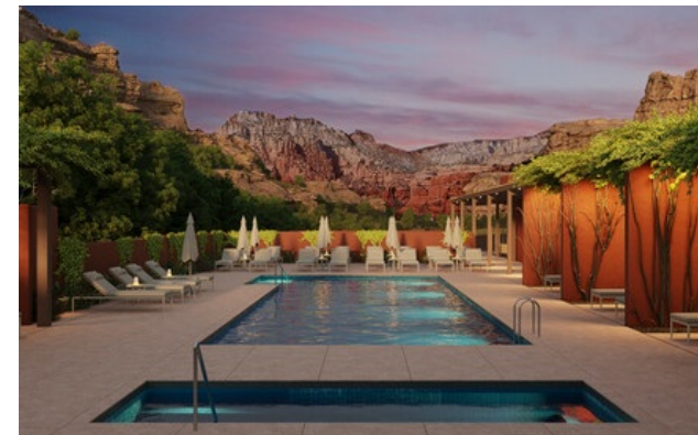
Membro Relais & Châteaux dal 2023 525 Boynton Canyon Road 86336, Sedona

Hotel e ristorante in montagna. Mii amo è un rinomato resort Spa & Wellness non lontano dal Grand Canyon, un'autentica oasi di pace situata tra le splendide rocce rosse del Boynton Canyon, uno dei più potenti vortici di energia spirituale a Sedona, in Arizona. Rientrate in sintonia con la natura e con la vostra essenza in un ambiente incantevole, dove gli spazi sono progettati per migliorare la connessione tra gli ospiti e il canyon. Rivestite con tappeti naturali, legno e coperte artigianali, le camere si aprono su un paesaggio immenso, una distesa punteggiata da fichi d'India e pini del deserto. Tutte quante dispongono di caminetti interni e patii privati. Apprezzato per il suo approccio olistico senza eguali, Mii amo offre soggiorni all-inclusive e personalizzati, compresi trattamenti su misura e meditazioni guidate ad opera di professionisti intuitivi ed esperti. Così connessi l'una all'altro, mente e corpo potranno gustare pienamente i sapori immaginati dallo Chef del ristorante Hummingbird, che predilige una cucina basata su ingredienti e prodotti locali.