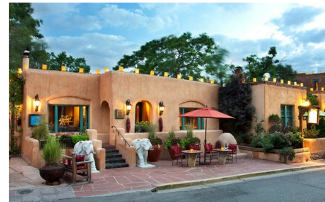
Membro Relais & Châteaux dal 2009 150 East De Vargas Street 87501, Nuovo Messico, Santa Fe

Hotel e ristorante in città. Nel quartiere storico «pueblo» di Santa Fe, questo superbo albergo è composto da un insieme di edifici di adobe ornati con tessuti colorati fatti a mano e bagni ricoperti di piastrelle a mosaico. Il lussuoso arredo è arricchito da antichità e tessuti dell'India Orientale e del Tibet. Mobili fatti a mano si fondono con un'architettura che mette insieme il retaggio degli indios e degli spagnoli -un crogiolo di culture e di colori per un viaggio sensoriale. Godetevi i concerti privati all'Opera, le attività sportive come l'escursionismo, lo sci o il golf oppure scoprite le opere di pittori e scultori di fama mondiale che si sono ispirati a questa città affascinante.