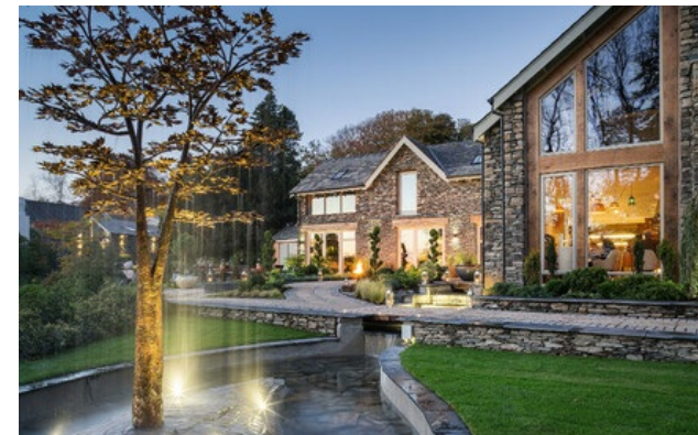
Membro Relais & Châteaux dal 2006 Crook Road Windermere (Cumbria)

Hotel e ristorante in campagna. Gilpin è un hotel di charme in un luogo davvero incantevole: il parco nazionale del Lake District. Nell'edificio principale, le stanze sono arredate in uno stile raffinato e moderno. Alcune di esse hanno un giardino privato e una jacuzzi in legno di cedro. Da parte sua, la superba Lake House (a un miglio dall'hotel principale) ospita soltanto alcune suite privilegiate che usufruiscono dei 40 ettari di parco con all'interno un lago privato e la Spa Space at Gilpin Hotel che offre trattamenti di haloterapia e una jacuzzi esterna. Abbandonatevi ai piaceri semplici di un luogo eccezionale, tra trattamenti distensivi per il corpo e attività sportive rinvigorenti.