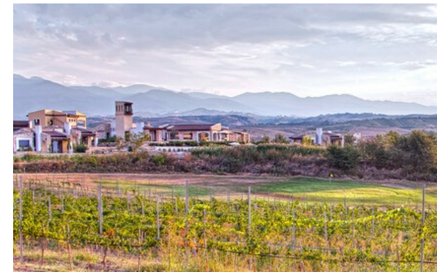
Membro Relais & Châteaux dal 2017 2821, Zornitza Village (Sandanski)

Hotel e ristorante in campagna. Scolpita nella pietra grazie al sogno di una famiglia di esteti innamorati della loro patria, la Zornitza Family Estate produce vino, miele e tartufi, coltiva frutta e verdura biologica e alleva il proprio bestiame. La residenza principale sfoggia un design moderno, utilizzando materiali tradizionali. La cucina è semplicemente fantastica; il servizio incantevole. Un soggiorno in questa proprietà è un'occasione unica per scoprire la parte meridionale della Bulgaria in tutta la sua ricchezza e autenticità: dalle tradizioni locali alla storia dei diversi siti archeologici, dalla regione della Tracia all'antica Grecia, passando per la degustazione di vini unici della straordinaria cantina della tenuta e delle tredici aziende vinicole dell'area.