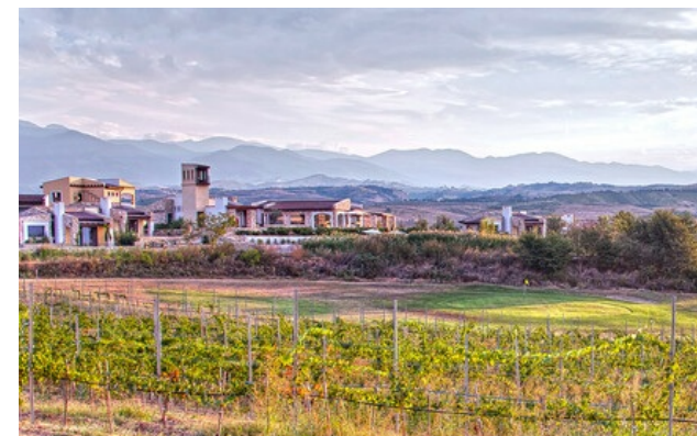
Membro Relais & Châteaux dal 2017 2821, Zornitza Village (Sandanski)

Hotel e ristorante in campagna. Scolpita nella pietra grazie al sogno di una famiglia di esteti innamorati della loro patria, la Zornitza Family Estate produce vino, miele e tartufi, coltiva frutta e verdura biologica e alleva il proprio bestiame. La residenza principale sfoggia un design moderno, utilizzando materiali tradizionali. La cucina è semplicemente fantastica; il servizio incantevole. Un soggiorno in questa proprietà è un'occasione unica per scoprire la parte meridionale della Bulgaria in tutta la sua ricchezza e autenticità: dalle tradizioni locali alla storia dei diversi siti archeologici, dalla regione della Tracia all'antica Grecia, passando per la degustazione di vini unici della straordinaria cantina della tenuta e delle tredici aziende vinicole dell'area.