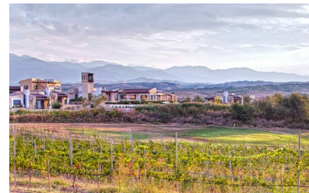
Membro Relais & Châteaux dal 2017 2821, Zornitza Village (Sandanski)

Hotel e ristorante in campagna. Scolpita nella pietra grazie al sogno di una famiglia di esteti innamorati della loro patria, la Zornitza Family Estate produce vino, miele e tartufi, coltiva frutta e verdura biologica e alleva il proprio bestiame. La residenza principale sfoggia un design moderno, utilizzando materiali tradizionali. La cucina è semplicemente fantastica; il servizio incantevole. Un soggiorno in questa proprietà è un'occasione unica per scoprire la parte meridionale della Bulgaria in tutta la sua ricchezza e autenticità: dalle tradizioni locali alla storia dei diversi siti archeologici, dalla regione della Tracia all'antica Grecia, passando per la degustazione di vini unici della straordinaria cantina della tenuta e delle tredici aziende vinicole dell'area.