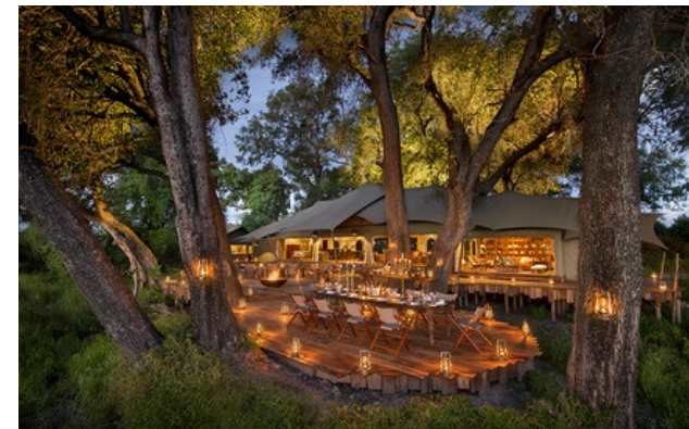
Membro Relais & Châteaux dal 2017 Duba Plains Private Reserve Okavango Delta

Lodge e ristorante in una riserva naturale. Questo paesaggio unico, fatto di bosco, isolotti e pianure alluvionali, ospita migliaia di animali – tra cui delle interessanti specie di Kalahari – che gli appassionati vengono appositamente ad ammirare. Siamo nel cuore pulsante del delta dell'Okavango, in una riserva privata di 77 000 ettari dove sono sistemate alcune tende, progettate per fondersi col paesaggio rievocando al contempo lo stile degli anni Venti. Un comfort estremo per queste tende leggermente sopraelevate, che offrono una splendida vista sulla pianura, esplorabile in 4x4 con una guida privata. Great Plains Conservation, che possiede il campo, è l'unico ad operare su questa concessione, offrendo così un accesso esclusivo a questo paradiso selvaggio.