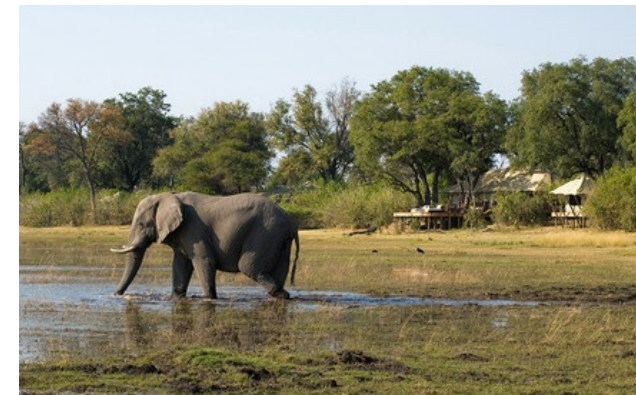
Membro Relais & Châteaux dal 2013 Selinda Reserve Selinda Reserve

Lodge e ristorante in una riserva zoologica. Estendendosi su oltre 32 000 acri, e collegando il delta dell'Okavango ai sistema fluviale del Linyanti e del Savute, la riserva privata Selinda rappresenta il vero spirito dell'Africa e, più nello specifico, del Botswana. Situata all'interno di questa area remota e selvatica si trovano le riserve della Great Plains Conservation Selinda e Zarafa. Progettato con l'ecologia al centro, lo Zarafa Camp è composto da grandi tende sontuosamente arredate, ricreando l'atmosfera dei primissimi safari nel loro stile tradizionale. Selinda Camp riassume brillantemente l'incontro delle culture grazie alle suite lussuose. In questa emozionante regione, potrete apprezzare le innumerevoli meraviglie della fauna selvatica del Botswana, un luogo in cui gli animali più rari possono riprodursi all'interno di una natura generosa. Avrete il grande privilegio di osservare i maestosi leoni di Birth of a Pride, il film diretto da Derek e Beverley Joubert per National Geographic, ma anche i licaoni, a rischio di estinzione, gli ippopotami che si bagnano nelle lagune e grandi branchi di elefanti che si spostano pacifici nelle zone circostanti. Uno spettacolo magico arricchito dai tramonti più belli al mondo.