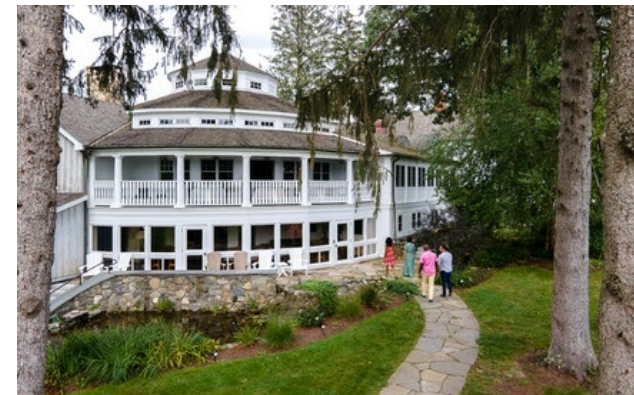
Membre Relais & Châteaux depuis 2008 155 Alain White Road 06763, Connecticut, Morris

Hôtel et restaurant à la campagne. Au coeur des vallées verdoyantes et des lacs limpides de la région bucolique de Litchfield Hills, le Winvian est un complexe hôtelier niché dans 45 hectares de parc luxuriant bordé d'érables centenaires. Pour concevoir ces 18 chalets uniques, 15 architectes ont été mobilisés. Posez vos bagages dans une cabane en bois de deux étages perchée à dix mètres du sol, dans un phare situé au milieu de la forêt, ou dans un lodge construit autour d'un chêne séculaire. Au programme : détente au spa, montgolfière, équitation, pêche à la mouche, courses automobiles et autres expériences inoubliables, à deux heures seulement de l'effervescence de New York et de Boston.