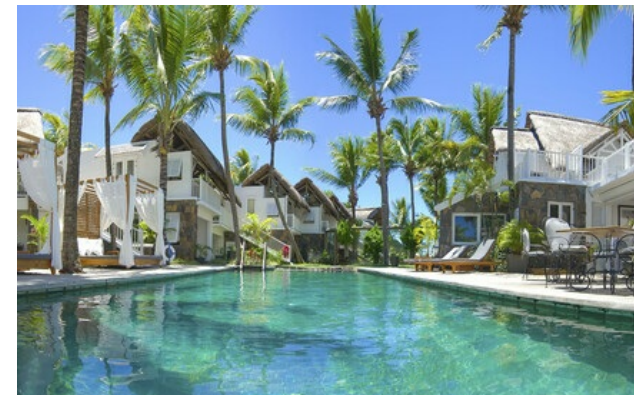
Membre Relais & Châteaux depuis 2013 Coastal Road, Pointe Malartic Grand-Baie Pointe aux Canonnières

Hôtel et restaurant en bord de mer. Dans une cocoteraie tout au bord de l'eau, une ravissante maison coloniale abrite un petit hôtel de charme meublé avec goût et délicatesse. Dans les chambres, les tons doux et neutres du mobilier Flamant Home Interiors contrastent avec le bleu de la mer et le vert des cocotiers. Le restaurant propose une cuisine fusion aux influences locales et internationales. Mais 20° Sud réserve d'autres trésors : le M/S Lady Lisbeth, plus ancien bateau à moteur de l'île, qui embarque quelques hôtes pour un dîner sous les étoiles dans les eaux calmes de la baie.