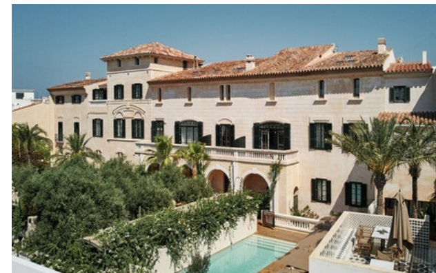
Membre Relais & Châteaux depuis 2015 Calle San Rafael 9 07760, Ciutadella de Menorca (Balears)

Hôtel et restaurant en bord de mer. Réunissant quatre somptueux palais dans le centre historique de Ciutadella, s'étendant sur 15 hectares de pinèdes en bord de mer et bénéficiant d'une grande richesse culturelle, Faustino Gran vous invite à vivre une expérience unique à Minorque, la plus sauvage des îles Baléares. Entouré d'eaux turquoise translucides et de paysages méditerranéens époustouffants, cet hôtel lumineux et exceptionnel dégage un charme inouï. Les 56 chambres et la villa spacieuse révèlent, à travers leurs subtilités décoratives et architecturales, la riche histoire de la propriété. Situé au sein du palais Can Faustino datant du XVIIe siècle, le restaurant gastronomique propose une cuisine valorisant la nature et les produits locaux. À proximité, les palais Cal Bisbe, Can Llorenç et Can Sebastià permettent de profiter en toute quiétude de vues magnifiques sur la cathédrale de Ciutadella. Avec ses piscines, ses solariums, son spa composé d'une piscine intérieure, d'une salle de sport, d'un sauna et d'un hammam nichés dans une ancienne grotte, Faustino Gran offre une escale paradisiaque invitant à la détente et aux plaisirs exquis.