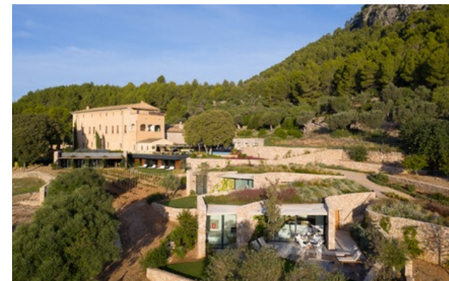
Membre Relais & Châteaux depuis 2005 Crta. Palma-Pollença, Km 50 E-07460, Pollença (Mallorca)

Hôtel et restaurant à la campagne. Dans cet ancien monastère sur les hauteurs de Majorque, l'ascétisme perdure dans l'épure de la décoration où le blanc des murs resplendit sur le bleu du ciel. Le spa est un paradis d'eau et de teck, où les huiles aromatiques sont issues de la flore de l'île. La piscine, un bivouac chic où de grands tissus blancs font de l'ombre à votre chaise longue. Les chambres ont vue sur la mer, les champs d'oliviers et la baie de Pollença. Des produits biologiques, tels que l'huile d'olive, le vin, les agrumes et les légumes, cultivés dans le parc, sont servis au restaurant. L'hôtel est si plaisant que l'on ne se résigne à en sortir que pour faire du vélo, se promener dans les montagnes ou profiter des plages et du terrain de golf.