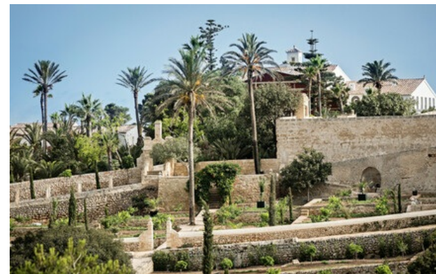
Membre Relais & Châteaux depuis 2019 Carretera de Llucalari Finca Santa Ponsa 07730, Alaior (Menorca)

Hôtel et restaurant à la campagne. Fontenille Menorca - Santa Ponsa, finca iconique de l'île de Minorque s'étendant sur 100 hectares, est un ancien palais du XVIIe siècle dont les jardins luxuriants en terrasses sont intégralement classés. C'est à bien des égards une propriété unique à Minorque. Reconstituée au milieu du XIXe siècle, la maison seigneuriale domine huit hectares de jardins en gradins à la végétation luxuriante : palmiers à profusion, figuiers géants, fleurs exotiques, bassins, champs d'orangers... Fontenille Menorca - Santa Ponsa fait figure de jardin des mille et une nuits au milieu des terres arides de l'île. Architecturalement, si les éléments minorquins prédominent, les influences espagnoles et maures sont présentes partout. Coupoles, moucharabieh et ziggourat miniature nous permettent d'entrevoir ce qu'étaient les fastes d'une maison princière au cours des siècles précédents.