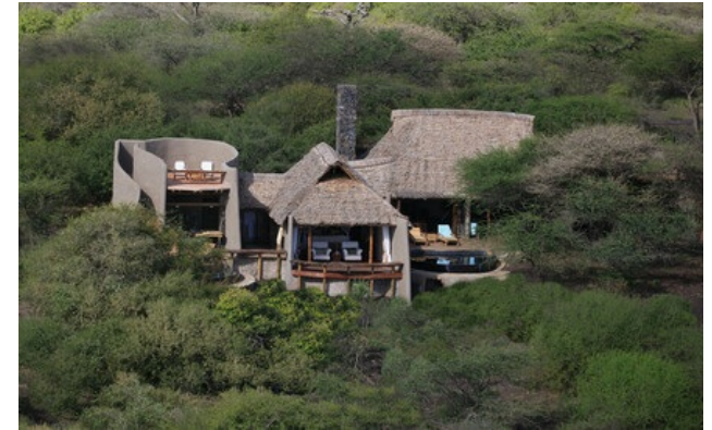
Membre Relais & Châteaux depuis 2013 Mbirikani Group Ranch Kenya Chyulu Hills - Amboseli

Lodge et restaurant dans une réserve animale privée. Réveil au pied des sommets enneigés du Kilimanjaro ; au loin, le rugissement d'un lion. ol Donyo Lodge est un pionnier parmi les safaris-lodges, précurseur du tourisme éthique et responsable: la collaboration avec la population Massaï locale a permis de combiner sauvegarde et subsistance. Installé sur les flancs des Chyulu Hills, ce lodge mélange design contemporain et traditionnel. C'est l'opportunité d'explorer l'Afrique d'une manière peu commune, à cheval ou en 4x4, ou encore posté dans une cache, à vingt pas de certains des plus grands éléphants du monde. Surplombant la savane à perte de vue, ol Donyo Lodge jouit d'une situation incomparable. C'est l'Afrique comme on l'imagine.