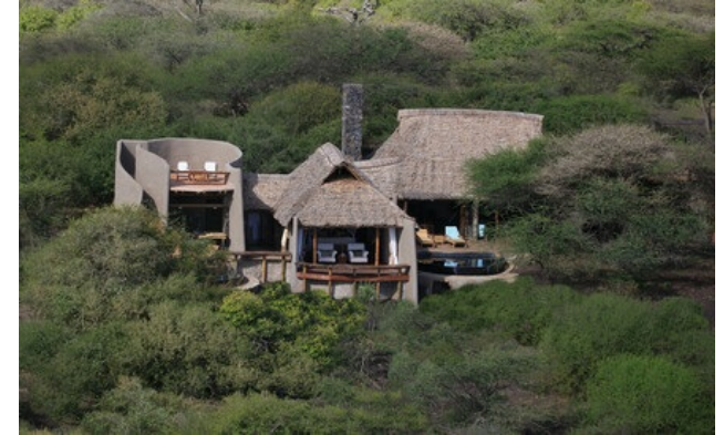
Membre Relais & Châteaux depuis 2013 Mbirikani Group Ranch Kenya Chyulu Hills - Amboseli

Lodge et restaurant dans une réserve animale privée. Réveil au pied des sommets enneigés du Kilimanjaro ; au loin, le rugissement d'un lion. ol Donyo Lodge est un pionnier parmi les safaris-lodges, précurseur du tourisme éthique et responsable: la collaboration avec la population Massaï locale a permis de combiner sauvegarde et subsistance. Installé sur les flancs des Chyulu Hills, ce lodge mélange design contemporain et traditionnel. C'est l'opportunité d'explorer l'Afrique d'une manière peu commune, à cheval ou en 4x4, ou encore posté dans une cache, à vingt pas de certains des plus grands éléphants du monde. Surplombant la savane à perte de vue, ol Donyo Lodge jouit d'une situation incomparable. C'est l'Afrique comme on l'imagine.