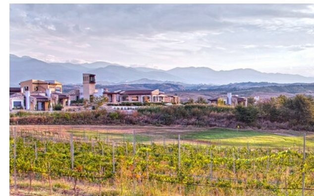
Membre Relais & Châteaux depuis 2017 2821, Zornitza Village (Sandanski)

Hôtel et restaurant à la campagne. C'est une propriété de lourdes pierres et le rêve un peu fou d'une famille d'esthètes amoureux de leur pays. Zornitza Family Estate produit son propre vin, son miel, ses truffes, cultive biologiquement fruits et légumes, élève ses bêtes. La maison elle-même se veut contemporaine, bien que faite de matériaux typiques. La cuisine y est remarquable, le service délectable. Zornitza Family Estate offre une chance unique de découvrir le sud de la Bulgarie entre luxe et authenticité, ses traditions locales, la richesse historique de ses sites, le passage des Thraces, la civilisation grecque, mais aussi de goûter des vins surprenants d'une cave remarquable ou des treize domaines viticoles tout proches.