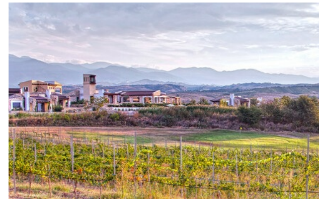
Membre Relais & Châteaux depuis 2017 2821, Zornitza Village (Sandanski)

Hôtel et restaurant à la campagne. C'est une propriété de lourdes pierres et le rêve un peu fou d'une famille d'esthètes amoureux de leur pays. Zornitza Family Estate produit son propre vin, son miel, ses truffes, cultive biologiquement fruits et légumes, élève ses bêtes. La maison elle-même se veut contemporaine, bien que faite de matériaux typiques. La cuisine y est remarquable, le service délectable. Zornitza Family Estate offre une chance unique de découvrir le sud de la Bulgarie entre luxe et authenticité, ses traditions locales, la richesse historique de ses sites, le passage des Thraces, la civilisation grecque, mais aussi de goûter des vins surprenants d'une cave remarquable ou des treize domaines viticoles tout proches.