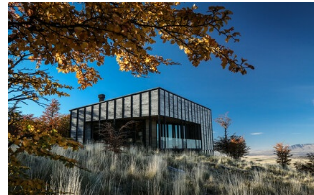
Membre Relais & Châteaux depuis 2014 Estancia Tercerra Barranca s/n. Torres del Paine (Region de Magallanes)

Hôtel et restaurant à la montagne. Se retrouver seul, ou presque, face à l'infini des terres de Patagonie : Awasi Patagonia propose une expérience unique en son genre. Situé dans une réserve privée, un ensemble de villas indépendantes offre une totale intimité pour profiter de vues incomparables sur la forêt, le lac Sarmiento ou les Torres del Paine. Un guide et un véhicule attribués à chacune permettent de partir à son rythme à la découverte de ces paysages somptueux, d'aller observer des condors, les guanacos et peut-être même un puma. La journée terminée, on se délecte de la chaleur du lodge principal et du restaurant ainsi que du confort des villas inspirées des refuges patagoniens.