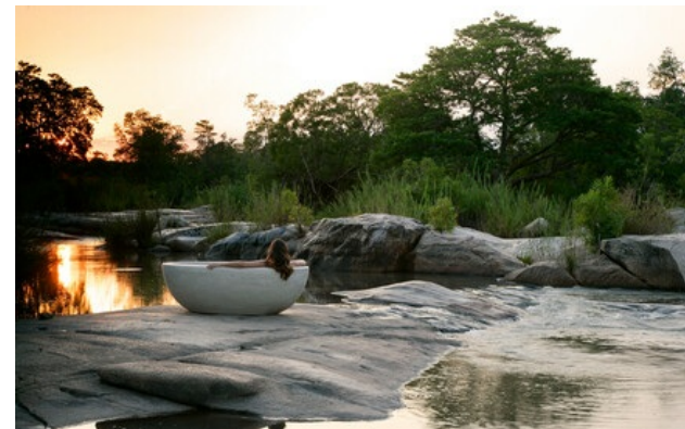
Miembro de Relais & Châteaux desde 1993 Sabi Sands Game Reserve 1350, Kruger National Park