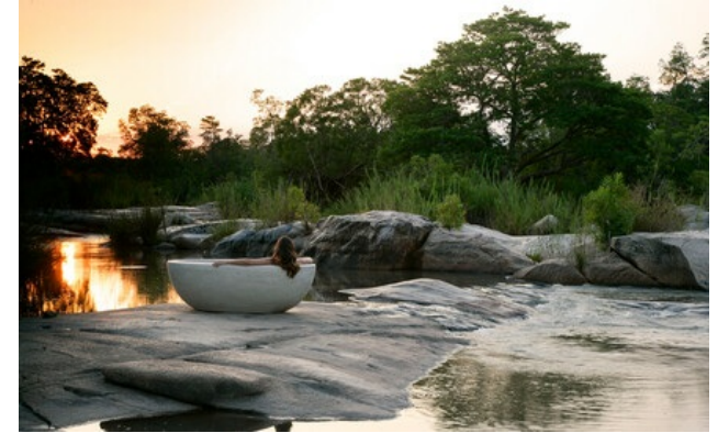
Miembro de Relais & Châteaux desde 1993 Sabi Sands Game Reserve 1350, Kruger National Park

Lodge y restaurante en una reserva de animales. Esta reserva de animales privada, sostenida por Nelson Mandela, en el corazón de la reserva de Sabi Sand, encarna el alma de África tal como la soñamos: una tierra que palpita al ritmo profundo del indómito bushveld. Desde hace 89 años, la misma familia se ocupa de esta reserva; la cuarta generación de los Varty le dará la bienvenida a este lodge, en perfecta armonía con la naturaleza. Los tres campamentos se encuentran a orillas del río Sand: las suites Tree, Pioneer y Private Granite son elegantes y con estilo, herederas de una larga historia. La cocina se distingue por los productos frescos locales, servidos con elegancia en un entorno natural.