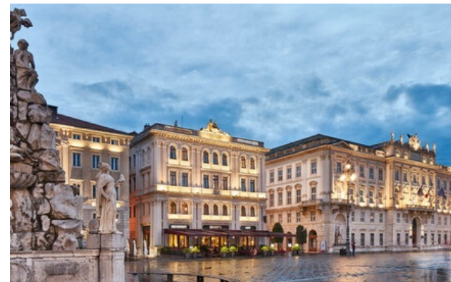
Miembro de Relais & Châteaux desde 2022 Piazza Unita' d'Italia, 2 34121, Trieste

Restaurante principal: almuerzo, salvo domingo, lunes noche, domingo noche, almuerzo y cena de domingo a martes (del 25 de julio al 26 de septiembre) (en julio/agosto). "Harry's Bistro": cena de martes a sábado y domingo mediodía, cena de miércoles a sábado (del 25 de julio al 26 de septiembre).