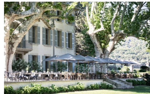
Miembro de Relais & Châteaux desde 2019 Route de Roquefraiche 84360, Lauris

Restaurante principal: almuerzo, salvo domingo y cena de lunes a miércoles.