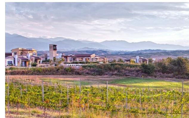
Miembro de Relais & Châteaux desde 2017 2821, Zornitza Village (Sandanski)

Hotel y restaurante en el campo. Zornitza Family Estate, construido a partir de pesadas piedras y los sueños de una familia de estetas enamorada de su país de origen, produce vino, miel y trufas, cultiva frutas y verduras orgánicas y cría su propio ganado. La casa principal cuenta con un diseño contemporáneo, pero construida a base de materiales tradicionales. La cocina es increíble, el servicio exquisito. Alojarse en esta propiedad supone una oportunidad única para descubrir el sur de Bulgaria con todo su lujo y autenticidad, desde las tradiciones locales a la riqueza histórica de sus lugares que datan de la época de Tracia del Norte y la antigua Grecia, a las catas de los impresionantes vinos en la excelente bodega de la propiedad y las trece bodegas de crianza cercanas.