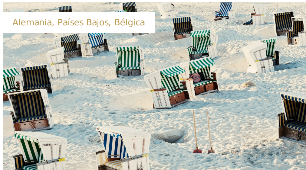
Alemania, Países Bajos, Bélgica