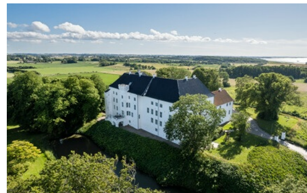
Relais & Châteaux Mitglied seit 2018 Dragsholm Allé 1 4534, Hørve

Hauptrestaurant: mittags und Abend von Sonntag auf Mittwoch (vom 3. Januar bis 10. Februar), mittags und Abend von Sonntag auf Dienstag (vom 11. bis 17. Februar).