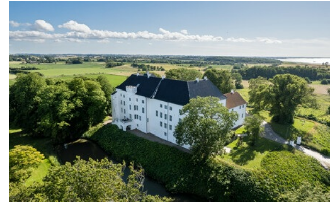
Relais & Châteaux Mitglied seit 2018 Dragsholm Allé 1 4534, Hørve

Hauptrestaurant: mittags und Abend von Sonntag auf Mittwoch (vom 3. Januar bis 10. Februar), mittags und Abend von Sonntag auf Dienstag (vom 11. bis 17. Februar).