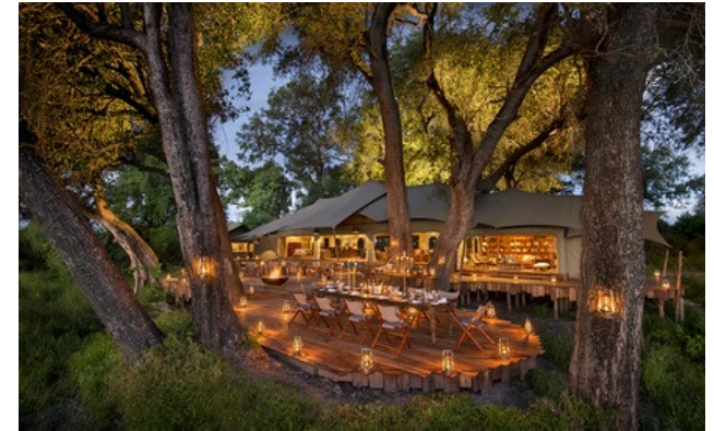
Relais & Châteaux Mitglied seit 2017 Duba Plains Private Reserve Okavango Delta

Lodge und Restaurant in einem Tierreservat. Diese einzigartige, aus Wäldern, kleinen Inseln und Schwemmland bestehende Landschaft beherbergt Tausende Tiere - darunter die interessanten Arten der Kalahari -, die Naturfreunde begeistern. Wir befinden uns mitten im Okavango-Delta in einem privaten, 77 000 ha großen Reservat, in dem einige Zelte aufgestellt wurden, die dank ihrer Gestaltung mit der Landschaft verschmelzen und dabei an den Stil der 1920er Jahre erinnern. Leicht erhöht und von außerordentlichem Komfort bieten sie einen prachtvollen Blick auf die Ebene, die man im Geländewagen mit eigenem Führer erkunden kann. Great Plains Conservation, Eigentümer des Camps, ist der einzige Veranstalter in diesem Gebiet und bietet so einen exklusiven Zugang zu diesem ursprünglichen Paradies.