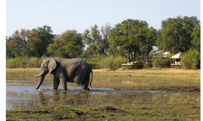
Relais & Châteaux Mitglied seit 2013 Selinda Reserve Selinda Reserve

Lodge und Restaurant in einem Tierreservat. Mit einer Fläche von über 130 km 2 verkörpert das Selinda-Reservat, das das Okavango-Delta mit den Flüssen Linyanti und Savute verbindet, den wahren Geist Afrikas und insbesondere jenen von Botswana. In dieser entlegenen Wildnis befinden sich die Camps Selinda und Zarafa der Great Plains Conservation. Das in ökologischer Bauweise errichtete Zarafa-Camp besteht aus großen, luxuriös eingerichteten Zelten, die das Ambiente der allerersten Safaris im traditionellen Stil nachempfinden. Dem Selinda-Camp gelingt es dank seiner luxuriösen Suites auf brillante Weise, eine Begegnung der Kulturen herbeizuführen. In dieser aufregenden Region können Sie die unzähligen Wunder von Botwanas Wildnis erleben – ein wahrer Brutplatz seltener Tiere, wo die Natur so unglaublich viel zu bieten hat. Sie haben das Privileg, die berühmten majestätischen Löwen aus dem Film Birth of a Pride von Derek und Beverley Joubert für den National Geographic sowie vom Aussterben bedrohte afrikanische Wildhunde, in Lagunen badende Nilpferde und große Elefantenherden zu beobachten, die friedlich durchs Umland streifen.. Es ist ein magisches Schauspiel, das von den schönsten Sonnenuntergängen der Welt untermalt wird.