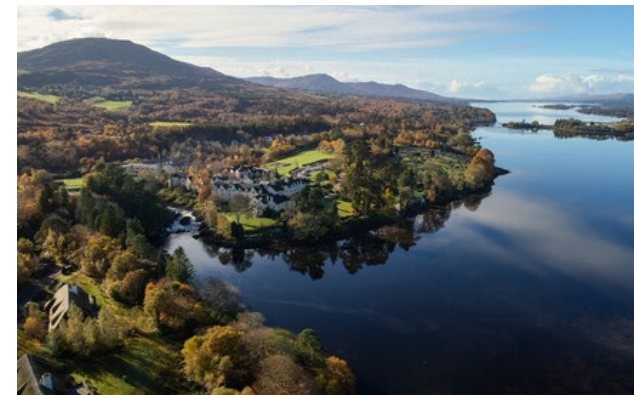
Relais & Châteaux Mitglied seit 1994 V93HR27, Kenmare Co. Kerry (Kerry)

Hauptrestaurant: mittags, Montag abends, Sonntag abends. „The Stables Brasserie & Bar“: Mittag von Montag auf Donnerstag.