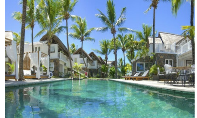
Relais & Châteaux Mitglied seit 2013 Coastal Road, Pointe Malartic Grand-Baie Pointe aux Canonnières

Hotel und Restaurant am Meer. In einem Kokospalmenhain, in der Nähe des Wassers, beherbergt ein Kolonialhaus ein von Charme geprägtes Hotel, das mit viel Eleganz eingerichtet ist. In den Zimmern stehen weiche Töne der Flamant Home Interiors-Einrichtung in einem Kontrast zum Blau des Meeres und dem Grün der Kokospalmen. Das Restaurant bietet eine kreolische und internationale Küche. Aber das 20 Degrés Sud Boutique-hôtel verfügt noch über weitere Schätze: Die MS Lady Lisbeth, die einige Gäste zu einem Dîner unter Sternen in den Gewässern der Bucht fährt.