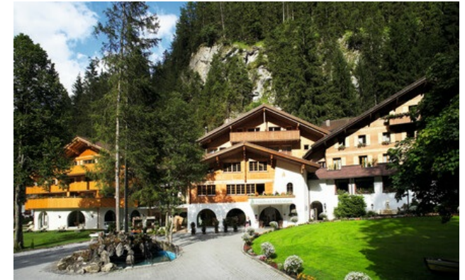
Relais & Châteaux Mitglied seit 2016 Doldenhornstrasse 26 3718, Kandersteg