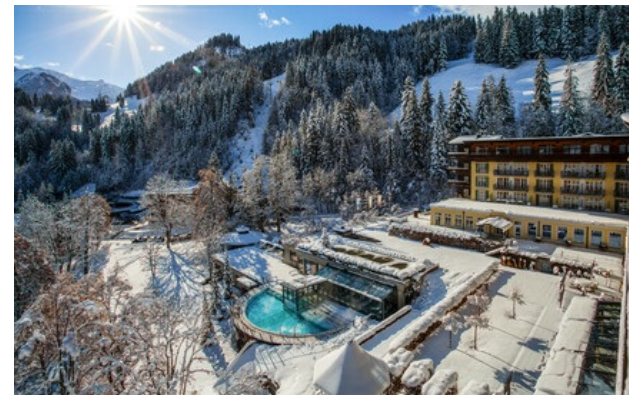
Relais & Châteaux Mitglied seit 2013 Badstrasse 20 CH-3775, Lenk im Simmental (Kanton Bern)

Hotel und Restaurant in den Bergen. Ende des 17. Jahrhunderts wurde ein erstes Kurhotel, das Bad Lenk, etwas abwärts von der reichsten alpinen Schwefelquelle nördlich der Alpen, des Balmes gebaut. Bis um die Jahrtausendwende wurde Schwefel als Heilmittel verwendet, trinken kann man es noch heute. Historische Schriften und eine Mischung von nostalgischen Kurhauselemente und moderner Architektur prägen das Lenkerhof Gourmet Spa Resort, ein erstklassiges Hotels mit einem breiten Angebot wunderbarer Wohlfühl-Behandlungen. Das „7 Sources Beauty & Spa“ ist nach dem Ort «Siebenbrunnen» benannt, an dem die Simme entspringt und wird von der Energie und Vitalität der Quelle inspiriert. In der Umgebung aus Naturholz und Naturstein genießen Sie eine echte Verjüngungskur. Die prachtvolle Landschaft der Umgebung lädt zu jeder Jahreszeit ein, die besonderen Freuden der Berge zu genießen.