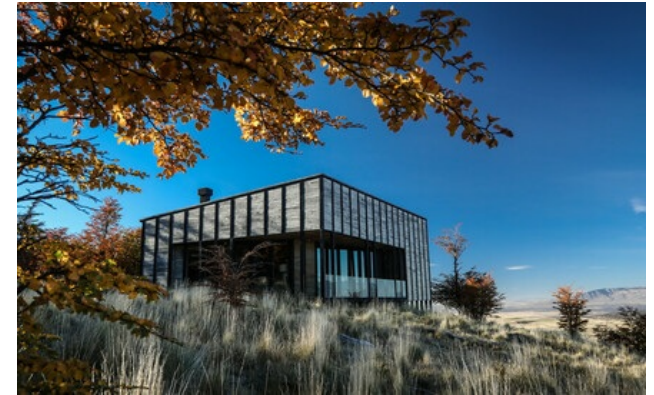
Relais & Châteaux Mitglied seit 2014 Estancia Tercerra Barranca s/n. Torres del Paine (Region de Magallanes)

Hotel und Restaurant in den Bergen. Fast allein in den unendlichen Weiten Patagoniens: Das Awasi Patagonia bietet ein absolut einmaliges Erlebnis. Inmitten eines privaten Reservats zeichnen sich mehrere kleine, freistehende Villen durch ihren intimen Charakter aus, mit unvergleichlichem Blick auf die Wälder, den See Sarmiento oder den Nationalpark Torres del Paine. Jeder Villa ist ein Führer und ein Fahrzeug zugeteilt, um die prächtigen Landschaften, Kondore, Guanakos und vielleicht einen Puma zu beobachten. Am Abend erwarten die Haupt-Lodge und das Restaurant die Gäste, bevor diese sich in die gemütlichen und komfortablen, von patagonischen Hütten inspirierten Villen zurückziehen.