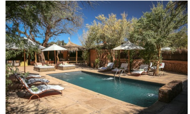
Relais & Châteaux Mitglied seit 2012 Tocopilla 551 San Pedro de Atacama (Antofagasta)

Hotel und Restaurant in einem Dorf. Das Awasi, im Norden Chiles, ist ein Ort von grandioser, berückender Schönheit im Herzen der Oase von San Pedro de Atacama. Die Gäste können die trockenste Wüste der Welt mit Allradfahrzeugen, begleitet von einem lokalen Führer, erkunden. Eine reiche Flora und Fauna, die Landschaft der Gebirgszüge, Salinen, Lagunen und Vulkane unter türkisblauem Himmel sind unvergesslich. In San Pedro de Atacama, einer idyllischen Stadt, geprägt von verschiedenen Zivilisationen, ist das Awasi in harmonischer Abstimmung mit der lokalen Kultur und der Umgebung errichtet worden. Es bietet den Gästen einzigartige, maßgeschneiderte Erlebnisse.